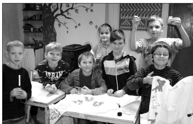
Rencēnu pamatskolas 3. klases bērni gatavoja akcijai

Otrdien, 10. februārī, SIA “VTU Valmiera” pulcējās pamatskolas vecuma bērni no Kocēnu, Brenguļu, Rūjienas un Rencēnu skolām, lai atrādītu, kādu veltījumu uzzīmējuši uz atstarojošajām vestēm.