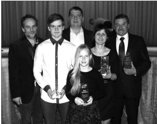
Laureāti no BMX kluba "Tālava"

Piektdien, 30. janvārī, Valmieras pagasta kultūras namā notika pasākums "Burtņieku novada sporta laureāts 2014", lai izteiktu pateicību sportistiem par viņu ieguldīto darbu un aizvadītajā gadā gūtajiem panākumiem, kas izskanējuši Latvijas, Eiropas un pat pasaules līmenī. Šogad apbalvojumam "Burtņieku novada sporta laureāts 2014" pretendēja 15 sportisti, 8 sportistes, 9 sporta pasākumi, 3 biedrības un 5 komandas.